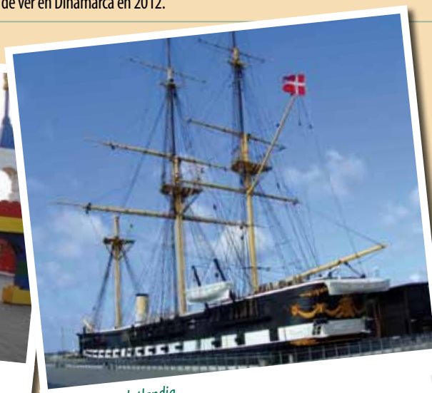
La Fragata Jutlandia