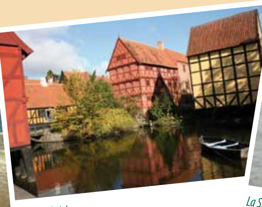
La ciudad vieja